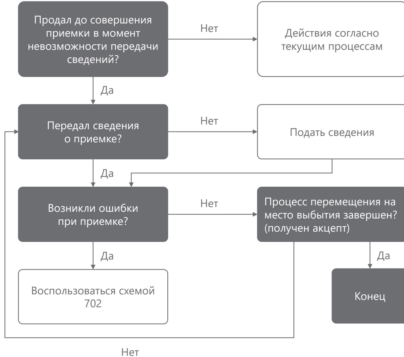
Схема работы для аптеки